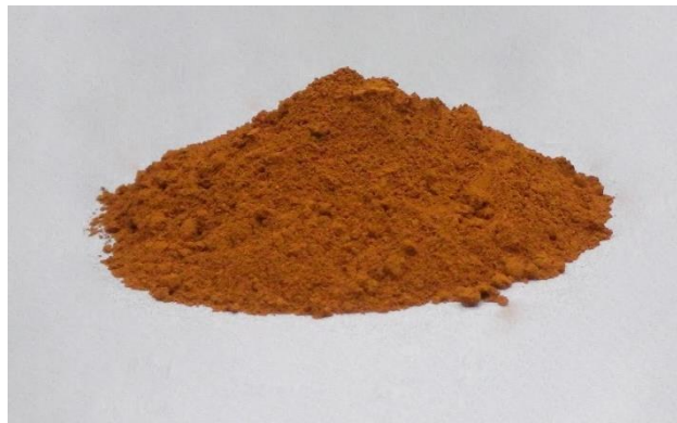
写真 五硫化アンチモン

AS-S1 はアンチモンおよび硫黄を主成分としたアモルファスの褐色粉末です。一般には五硫化アンチモンの名称で親しまれ、主に真鍮、ブロンズなどの銅合金建材表面の硫化いぶし仕上げ用に表面処理剤として使用されています。